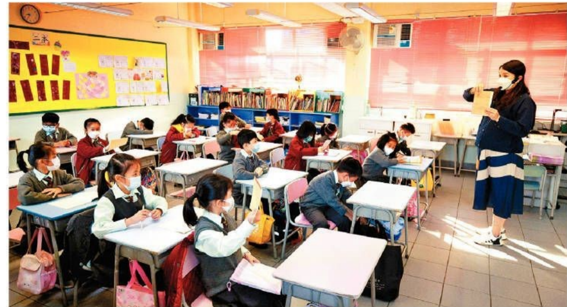
最後一批校外評核報告出爐，有10間學校表明不會將外評報告的全文上載學校網頁。

早前特殊學校的外評報告因建議學校加強國民教育、批評學生唱國歌聲線細弱而備受社會關